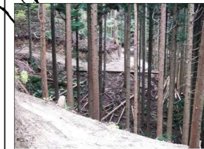
【板井原県有林:森林面積 537ha】 H16年に森林認証(SGEC)を取得し、環境に優しい施策を実践。H22年にカーボンオフセットを推進するため「鳥取県県有林J-VERプロジェクト」の認証を受け、企業等に販売している。(日野町板井原)