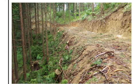
【鳥取式作業道の推進】 災害に強く、長期間の使用に耐えるように、転圧等丁寧な施工と、早期緑化を行うための表土ブロックを施工する作業道の作設を推進している。