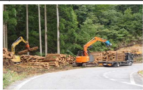
【路網ネットワークを形成する幹線となる林道の整備】 とっとり森と緑の産業ビジョンによる持続可能な森林経営の確立と、適正な森林整備の推進により森林の多面的機能の高度発揮を図るため、森林整備を効率的に行う上で不可欠な、林内路網の幹線である林道の整備を行っています。(林道窓山線:日南町上萩山(左)整備状況、日南町新屋(右)利用状況)