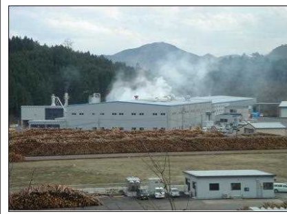
【日野川の森林(もり)木材団地】 日野川流域の総合木材流通加工拠点。(株)オロチ、(株)米子木材市場、山陰丸和林業(株)が進出。(日南町下石見)