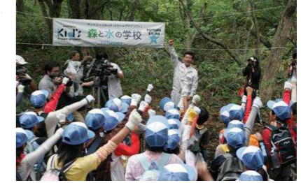
【とっとり共生の森】 ○天然水の森 奥大山(江府町) …サントリー(株) ○とっとり日通の森(日南町) …日本通運(株) 県・市町村が企業と地元の架け橋となってきた共生の森において、森林の保全活動、体験学習を行っている。(江府町御机 サントリー(株))