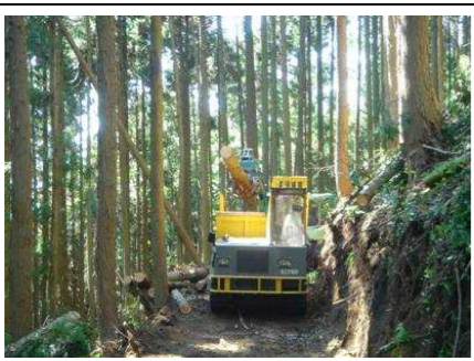
【低コスト林業モデル団地】 施業の団地化、路網の高密度化と崩れにくい作業道を組み合わせ、伐採搬出コストを削減するためのモデル的取組みを行っている。(日南町下石見)