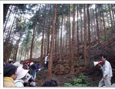
【森林環境保全税の活用】 放置され手入れができていない森林を強度間伐し、公益的機能の回復を行っている。(日野町下菅)