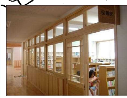
【日南町庁舎・日南小学校】 地域で生産・加工された木材を使用した木造公共施設。地域材利用のシンボル。日南小学校には(株)オロチのLVL使用。(日南町霞)