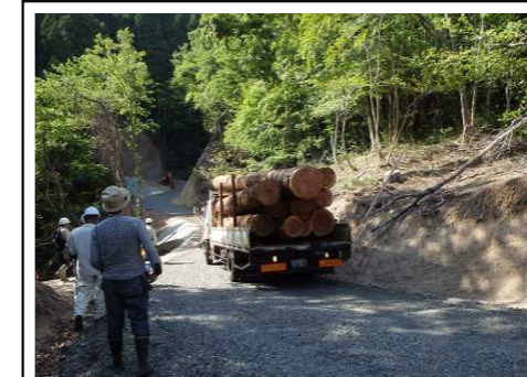
【林業専用道の整備】 林道までの木材運搬は林内作業車や2トン程度のトラックで行われていましたが、大型トラックが通行できる林業専用道を整備することで大幅な時間短縮とコストの削減に繋がっています。(日南町上萩山)