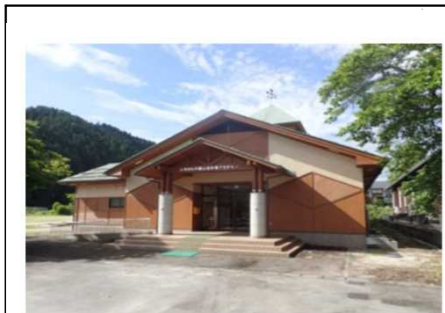
【にちなん中国山地林業アカデミー】 現場で即戦力となる林業技術者の育成を目的にH31年4月に開校。(日南町多里)